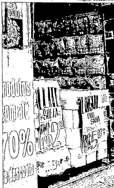
Produtos sobre o prazo de vencimento