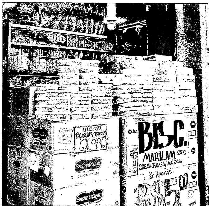
Produtos próximos ao fim da validade terão de ser expostos com a

O comerciante deverá apresentar cartazes e deixar a informação de forma legível, mostrando a validade do produto que tiver validade igual ou infe-