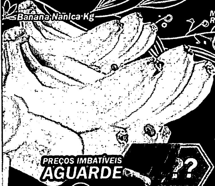
Banana Nanica Kg