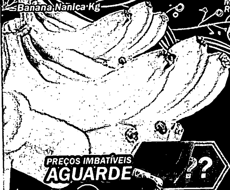
Banana Nanica Kg