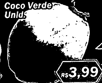
Coco Verde Unid.