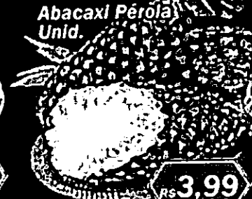
Abacaxi Pérola Unid.