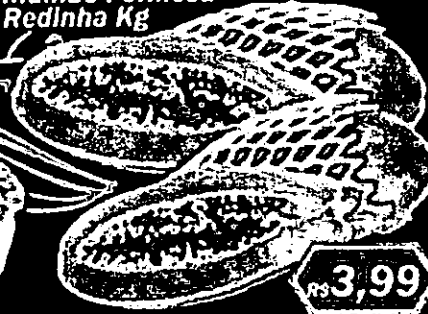
Mamão Formosa Redinha Kg